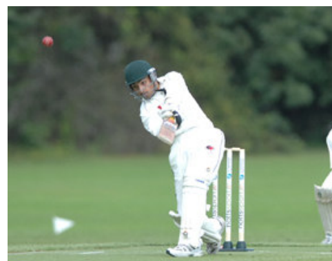
Usman Khan en action contre l'Allemagne

Vous pouvez consulter tous les résultats ici : http://www.icc-europe.org/EUROU17B/results.shtml